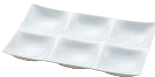
白磁・凧 六つ仕切り

19-231-04(26865) 2,750円 約25.7×25.7×H2.9cm