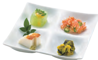
白磁・凧 与つ仕切り

19-231-02(32264) 1,250円 約25.8×8.5×H2.9cm