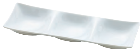
白磁・凧 三つ仕切り

19-231-02(32264) 1,250円 約25.8×8.5×H2.9cm