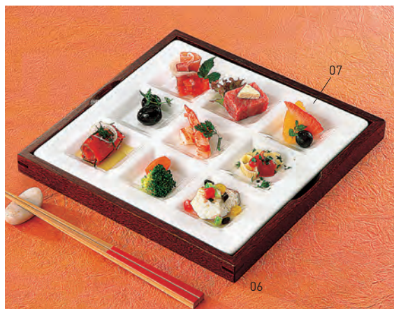
9ピース皿専用トレイ

19-231-05(32266) 2,000円 約25.7×17.1×H2.9cm