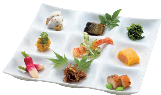
白磁・凧 九つ仕切り

19-231-03(32265) 1,450円 約17.1×17.1×H2.9cm